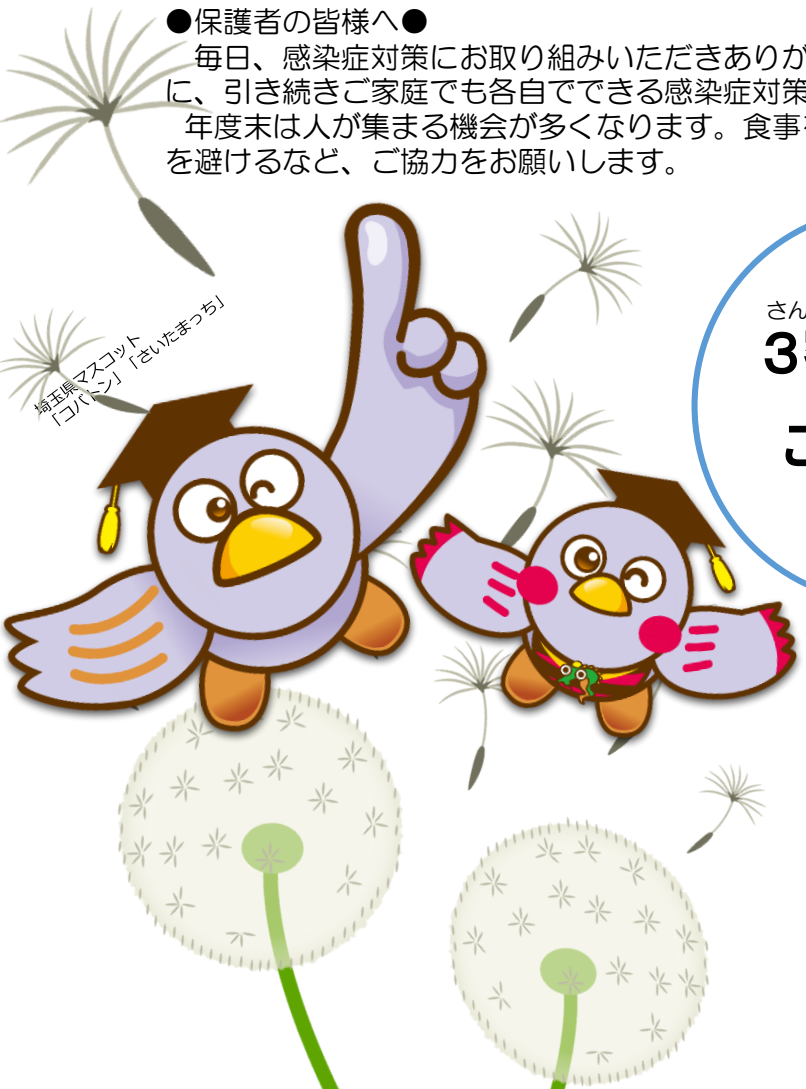
埼玉県マスコット「コバタン」「さいたまつち」

年度末は人が集まる機会が多くなります。食事を伴う席がある場合には健康観察を行うとともに、少人数・短時間・大声を避けるなど、ご協力をお願いします。