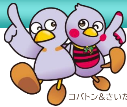
コバトン&さいたまっちょ